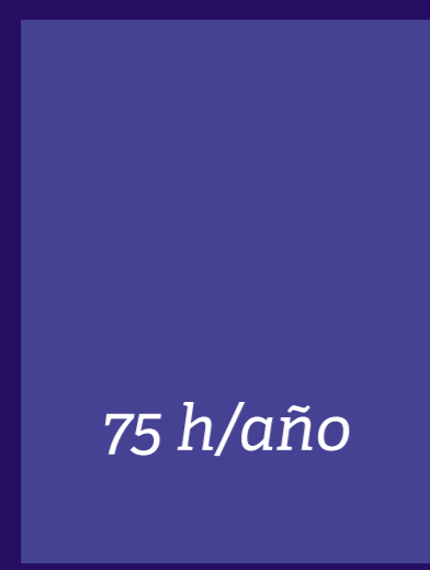
Solución Sage SII Básica

*Gestionando 500 facturas al mes/ 2 envíos semanales/ coste - trabajador 18 €/h