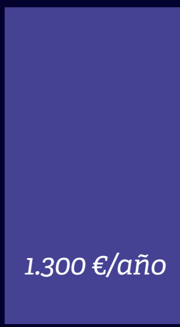
Solución Sage SII Básica